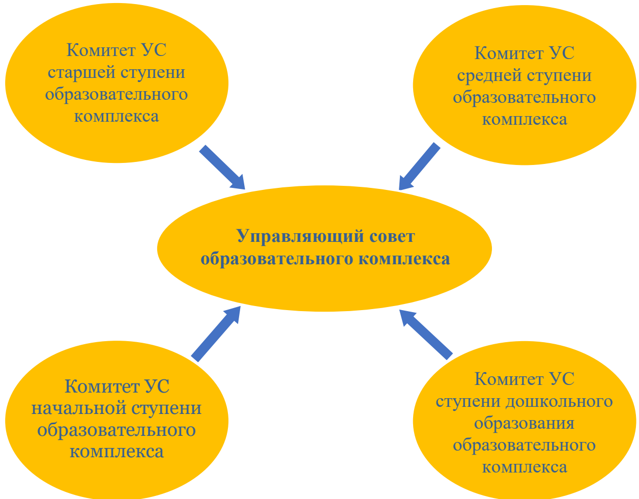
Рис.2. Управляющий совет образовательного комплекса. Второй вариант организации.

соответствующей ступени (структурного подразделения) – это вопрос открытый и ответ на него зависит от объема функций и полномочий комитета. То же самое можно сказать и в отношении «структурно-территориального» комитета, рассмотренного в первом варианте.